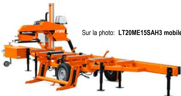
Sur la photo: LT20ME15SAH3 mobile

Division automatique SW Augmente la productivité et la précision en utilisant des composants électroniques robustes afin de positionner rapidement la tête pour la coupe suivante.