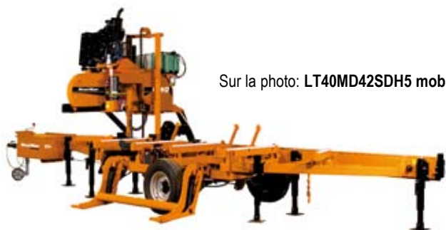
Sur la photo: LT40MD42SDH5 mobile

Augmente la productivité et la précision en utilisant des composants électroniques robustes afin de positionner rapidement la tête pour la coupe suivante.