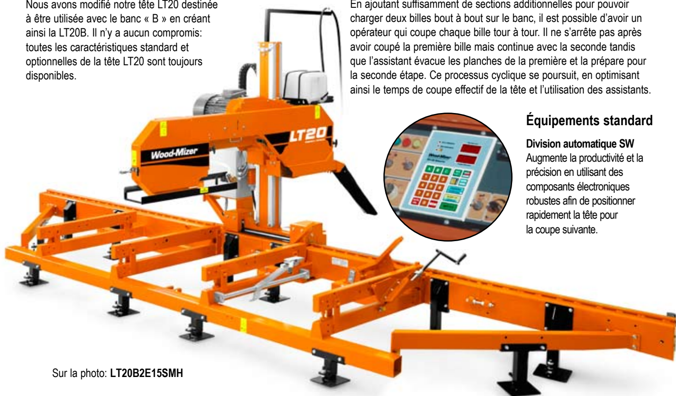
Sur la photo: LT20B2E15SMH

Nous avons modifié notre tête LT20 destinée à être utilisée avec le banc « B » en créant ainsi la LT20B. Il n'y a aucun compromis: toutes les caractéristiques standard et optionnelles de la tête LT20 sont toujours disponibles.