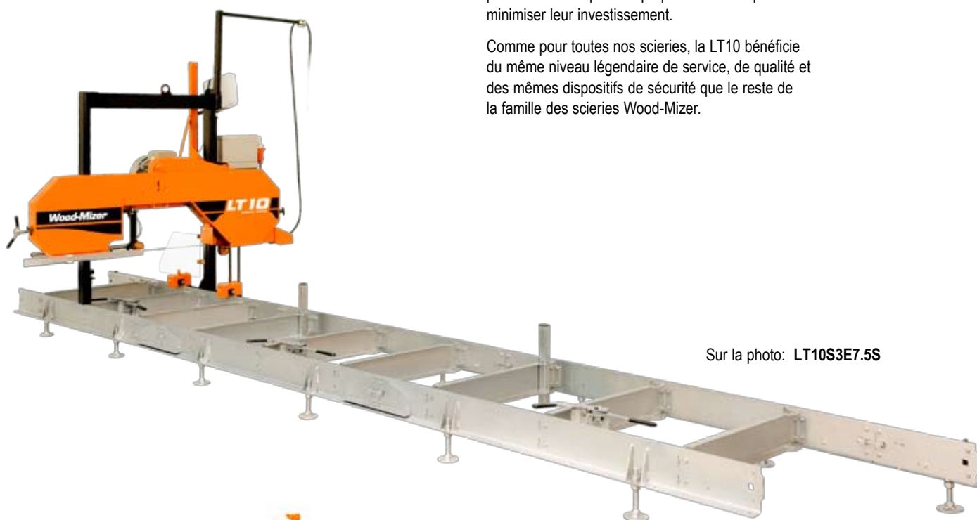
Sur la photo: LT10S3E7.5S

Comme pour toutes nos scieries, la LT10 bénéficie du même niveau légendaire de service, de qualité et des mêmes dispositifs de sécurité que le reste de la famille des scieries Wood-Mizer.