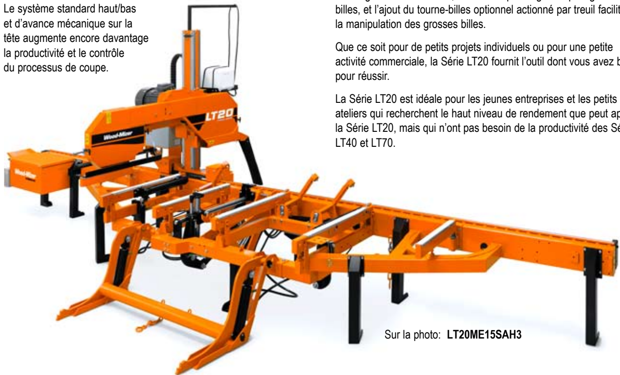
Sur la photo: LT20ME15SAH3

Le système standard haut/bas et d'avance mécanique sur la tête augmente encore davantage la productivité et le contrôle du processus de coupe.