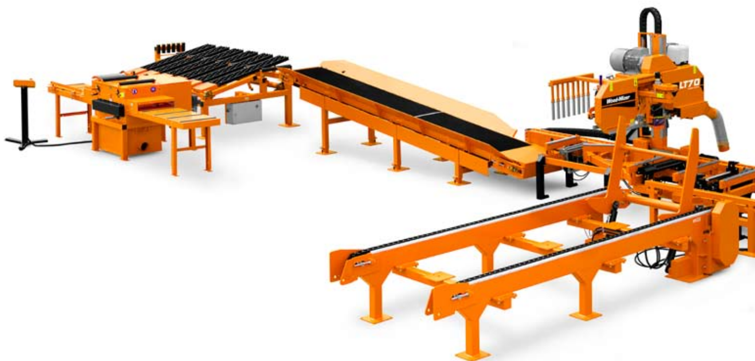
Sur la photo: LT70Remote avec tables modulaires et plateau pour billes