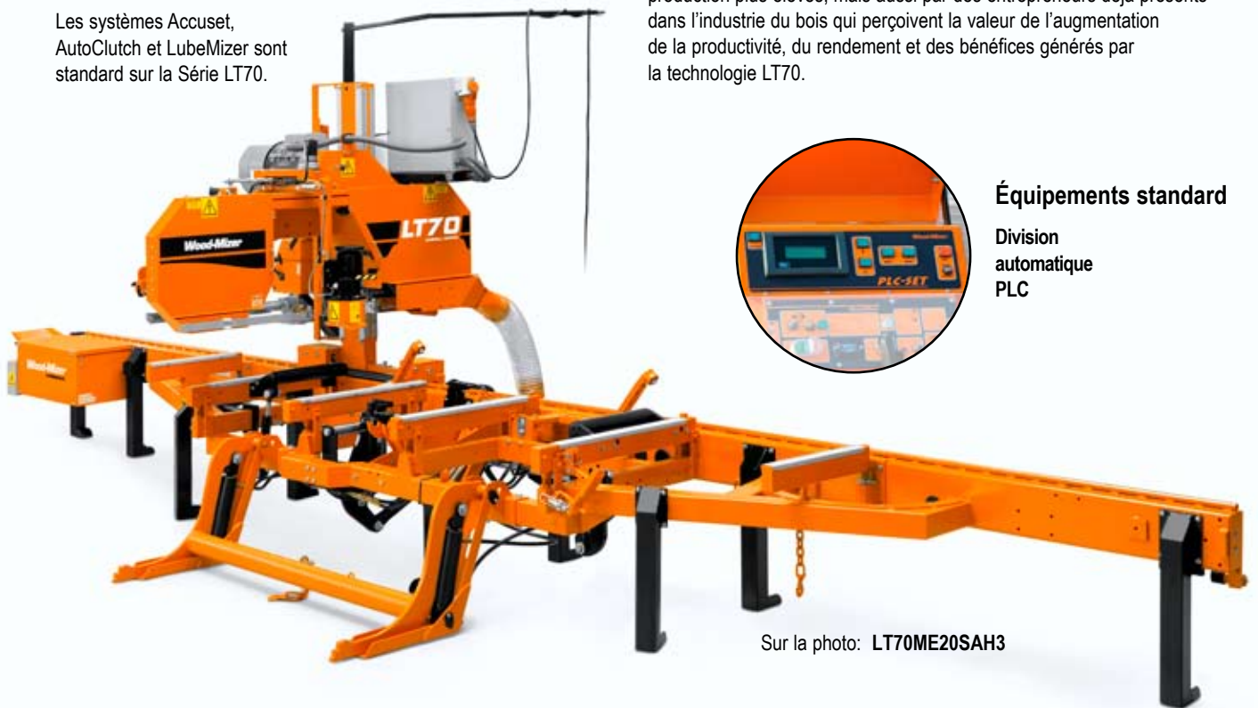
Sur la photo: LT70ME20SAH3

La Série LT70 est souvent achetée par d'anciens propriétaires de scieries Wood-Mizer qui recherchent maintenant des niveaux de production plus élevés, mais aussi par des entrepreneurs déjà présents dans l'industrie du bois qui perçoivent la valeur de l'augmentation de la productivité, du rendement et des bénéfices générés par la technologie LT70.